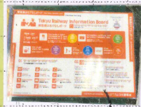
↑親切おもてなしボード 東急は常時おもてなしボード