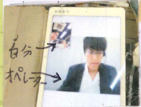
↑スマイルコール (相鉄線 緑園都府駅)

駅係員、全員に英語の講習を実施 (相鉄・イーラインク、東急・おもてなし講座) 駅ではポキトーク(ほんやくき)などを使 用(小田急・相鉄) スマイルコール(外国語対応の オペレーターと直接会話のできる サービス)を使用することで、より丁寧な サービスを心がけている。 多くの鉄道会社に取材することで 国土交通省の指導の元、 各鉄道会社が独自に 工夫していることがわかった。 競技だけでなく、それを支える 別の面にも目を向けること ができ、とても興味深かった。