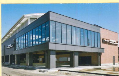
羽沢横浜国大駅(新駅) 今回の相互直通運転に 合わせて新しく開業する。 (新聞の題名もこのデザイン)

開業日は11月30日 相模鉄道株式会社(相鉄)と東日本旅客鉄道(JR東日本)は2019年11月30日から相鉄・JR直通線を使用して相互直通運転を開始する。 相鉄・JR直通線は、相鉄線西谷駅より約27kmの距離を新設し、羽沢横浜国大駅からJR東海道貨物線・横須賀線を經由して新宿方面へ直通運転を行うもの。これにより広域鉄道ネットワークが拡充され、乗りかえ回数削減と速達性の向上が図られる。 12000系準備万端 JR線との直通運転に向けて相鉄は12000系を導入した。前面デザインは獅子口をモチーフとし、一足先に東急線直通用に登場した20000系よりもややキリッとした顔つきとなった。 12000系はJR東日本のE233系をベースとしており、すでに相鉄線内で運用に入っているほか、JR線内でも試運転をしており、準備万端だ。なお、東急線との直通は2022年を予定している。